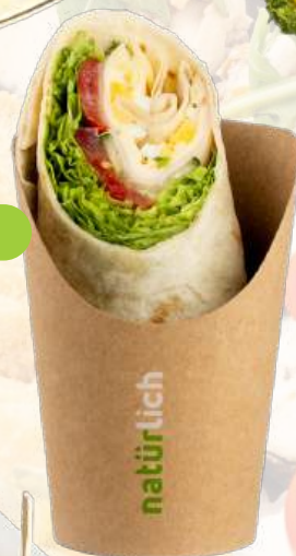
Wrap mit Schinke Käse Ei