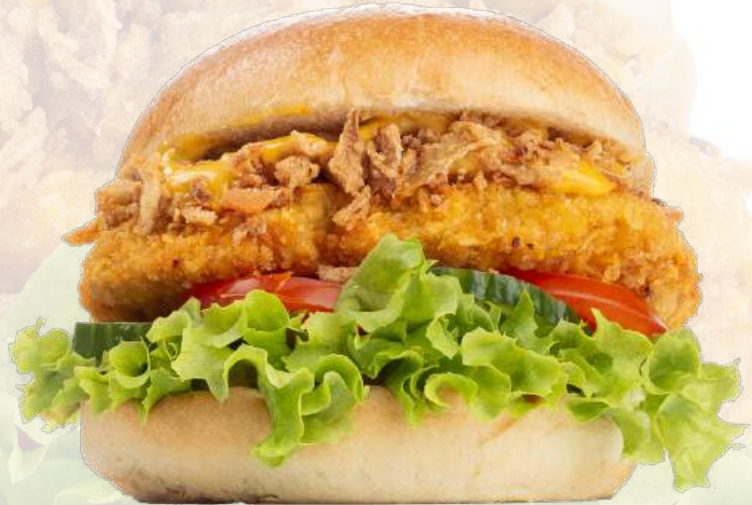
Joppie Chicken Burger